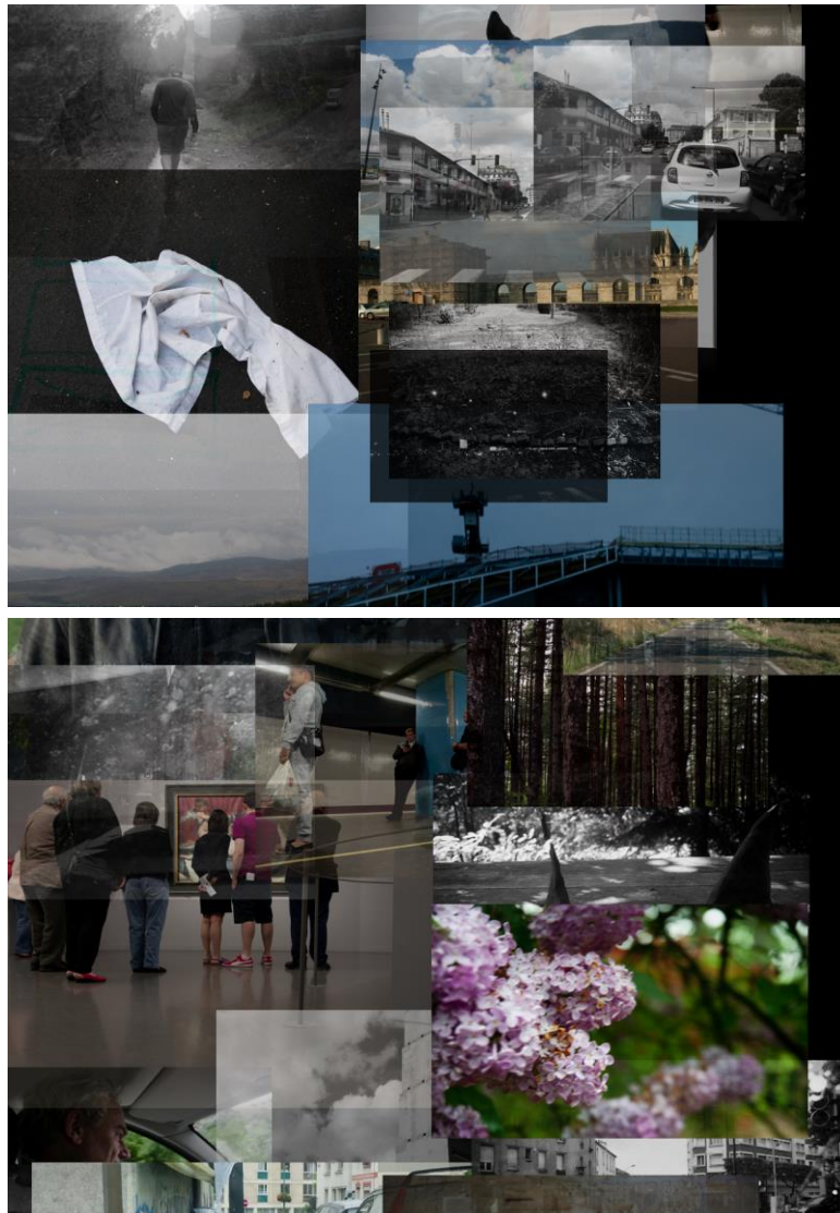
Fig. 2 et 3. Philippe De Jonckheere, Sans titre , 2015. http://www.desordre.net/bloc/vie/reprise/index.htm , consulté le 20/11/2018. © Philippe De Jonckheere

L'identité, l'identitaire, chez De Jonckheere, n'est pas lisse. Matière ample, informe et mobile, elle n'incarne pas l'« espace du propre et de l'identique » 8 . Elle apparaît plutôt comme l'espace de l'hétérogène, du divers, dessinant un domaine de l'inconstance, de la mobilité, de la précarité, et même de l'hétéroclite ; ce dont rend superbement compte son projet La Vie (comme elle va) 9 qui se présente sous la forme de photographies disparates superposées, venant dresser un chemin existentiel autre qu'agendaire : une constellation sensible, qui affiche un paysage émotionnel et mémoriel filandreux, mosaïque, complexe.